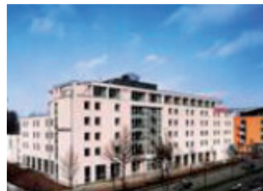
Das GHotel Göttingen liegt zentral.

Anfahrt: Über die A 7, Abfahrt Göttingen (Göttingen/Dransfeld). Nach der Abfahrt in Richtung Stadtmitte (ca. 2,5 km), dann bitte links halten Richtung Bahnhof West (Agentur für Arbeit / Cinemaxx). Auf der rechten Seite befindet sich das mit dem GHOTEL kooperierende Parkhaus. Das GHOTEL befindet sich nur etwa 300 m vom Bahnhof entfernt, Ausgang Richtung Bahnhof-Westseite.